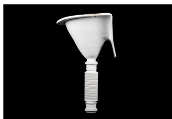
avec raccord à un siphon "sec"

Frais d'expédition par séparateur 15€ TTC